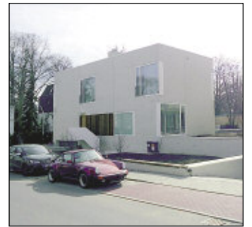
Ips/Cb. Neue Eigenheime

Erschließungskosten und Außenanlagen sollten im Festpreis enthalten sein. Der Erwerber ist daran interessiert, Zahlungen nur nach dem lastenfreien Eigentumserwerb und der vertragsgemäßen Fertigstellung des Objektes zu leisten. Wichtig ist ein Zeitplan mit verbindlichem Fertigstellungstermin. Durch einen Bauzeitenplan werden die Kosten in möglichst viele Einzelpositionen aufgeteilt. Manche Unternehmen wollen sich Preiserhöhungen vorbehalten, zum Beispiel aufgrund gestiegener Handwerker- und Materialkosten.